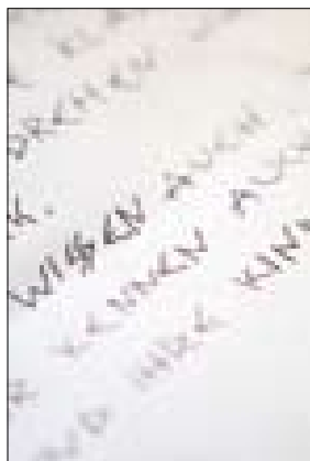
I det første brev blev Charlottes søsters små børn truet: »Vi kender også din søster og dine børn - og så deres navne.«